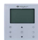
KCT-03 SR Standard